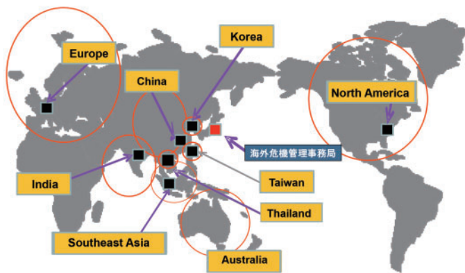
海外9地域に安全管理責任者を配備

積水化学グループでは、社規「海外安全管理規則」に基づいた、海外危機管理担当役員を頂点とするピラミッド型の海外危機管理組織(海外危機管理担当役員-海外危機管理事務局(長)-地域長-拠点長)を形成しています。この組織を中心に危機管理情報の共有やタイムリーな注意喚起、渡航規制の指示等緊急時対応を実施するなど、出張者、駐在員、現地従業員をサポートしています。