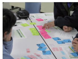
読み方ワークショップ