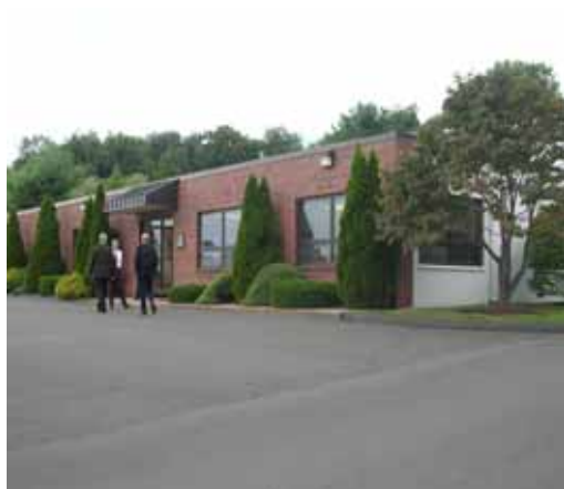
ハイトカンパ社 本社外観

管路更生市場は、世界的に今後大きな需要が見込める成長市場です。積水化学は「SPR工法」を機軸に国内 No.1 の地位を磐石なものにするとともに、「テクノロジー」「ワールドワイド」「バリューチェーン」の 3 つの成長のキーで事業領域を拡大し、グローバル No.1 を目指します。管路更生の大きな市場は、都市インフラの老朽化が本格化している欧米を中心とした先進国ですが、ハイトカンパ社買収により米国における事業基盤を獲得できました。今後は欧州への進出も検討し、『SPR』を管路更生のグローバル No.1 ブランドに進化すべく、さらなる拡大戦略を推進していきます。