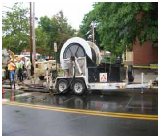
管路更生工事現場