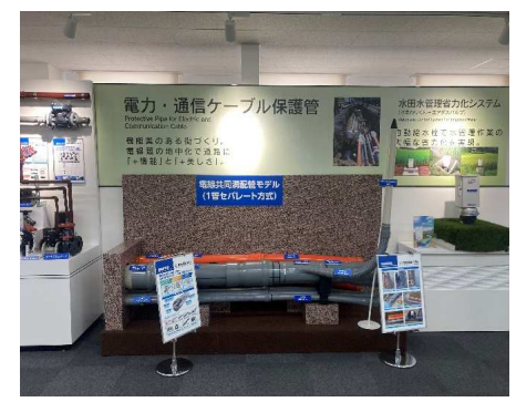
電力・通信ケーブル保護管

8月7日(月)に滋賀県栗東工場にて、今後開催予定である千葉積水オープンセミナー土木版用の動画の撮影を行いました。千葉積水で展示していない製品で栗東工場にて製造している製品(RCP管・ドロップシャフト・FFU等)は動画にてご紹介させて頂く予定です。現在開催中の建築版だけでなく今後は土木版も開催予定ですので皆様のご来場をお待ちしております。