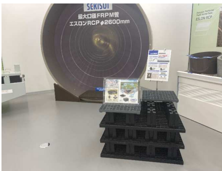
RCP管及びクロスウェーブ