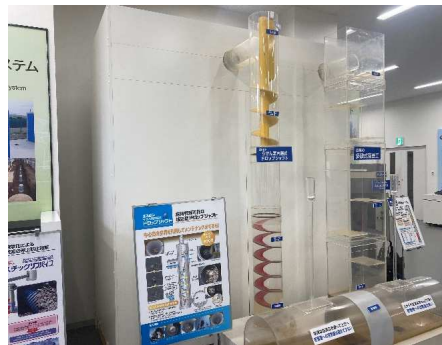
ドロップシャフト