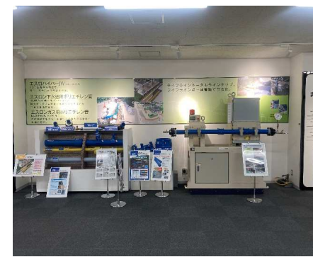
ポリエチレン管各種