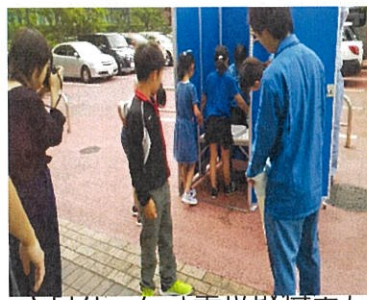
課外授業サポート