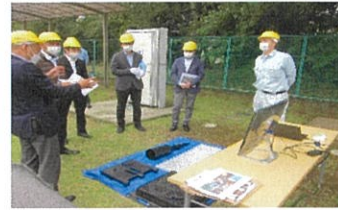
雨水対策鉄蓋各種現品説明

災害用トイレや雨水対策製品をサポート企業の製品含めてトータル提案させていただきます