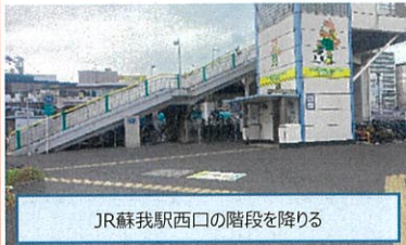
JR蘇我駅西口の階段を降りる

JR蘇我駅⇔千葉積水工業の往復送迎バスをご準備させていただきます 乗車のご希望の方は申込書にご記入願います