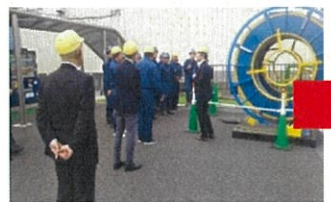
SPR工法製管デモ(管路更生) ※オプション