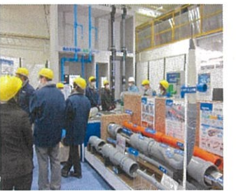
無電柱化製品モデル配管見学