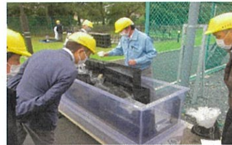
レインステーションデモ(道路用)