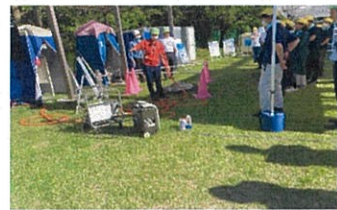
可搬式ポンプデモ