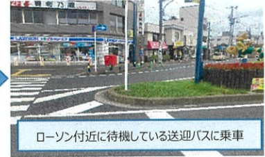
ローソン付近に待機している送迎バスに乗車