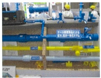
ポリエチレン管各種モデル配管見学