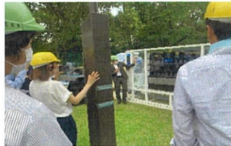
クロスウェーブデモ(敷地内用)