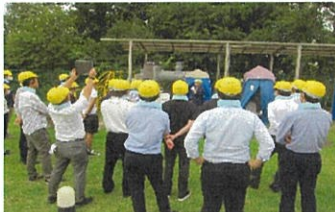
災害用トイレ概要説明