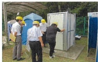
駐輪場型トイレ組立作業