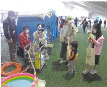
防災イベント各種サポート