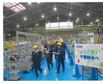
工場生産ライン見学