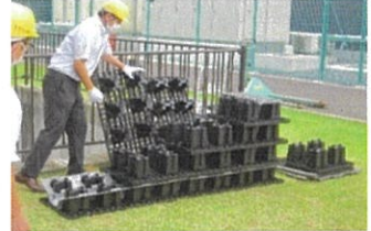
CWトレンチ(小規模トレンチ)組立作業