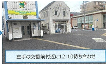
左手の交番前付近に12:10待ち合わせ