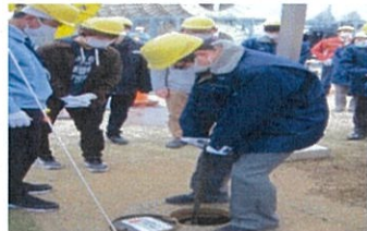
災害用トイレゲート開閉作業