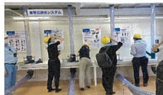
単管式排水システムの排水実験