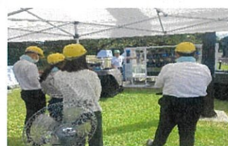
クロスウェーブのデモ実演