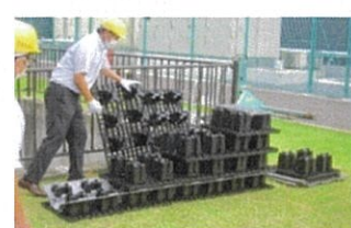
CWトレンチの組立作業