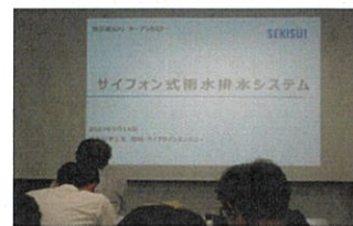
雨水ハイパー-RDの講義