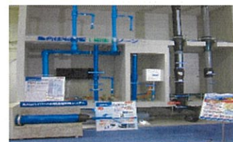
給排水モデル配管の見学