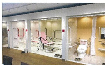
ショールームの見学②