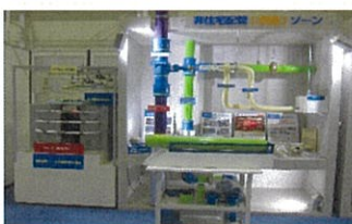
空調モデル配管の見学