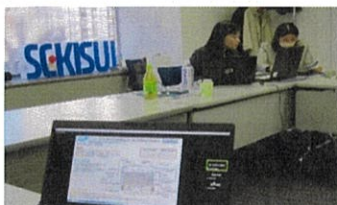
ユニットバスの講義①