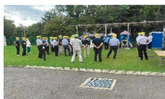
災害トイレの概要説明