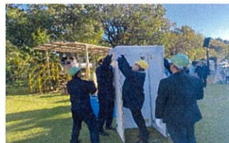
災害トイレ用建屋の組立実演