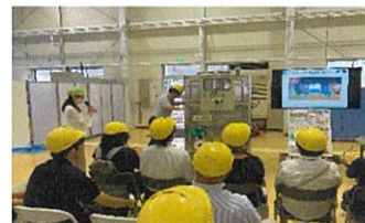
給水タンクのデモ実演