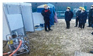
災害トイレ用建屋の現品説明