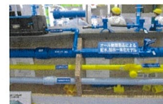
ポリエチレン管各種モデル配管の見学