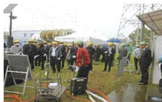
可搬式ポンプのデモ実演