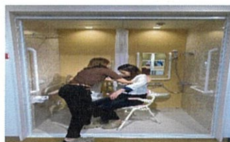
ショールームの見学①