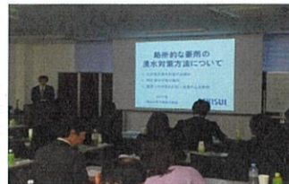
クロスウェーブの講義