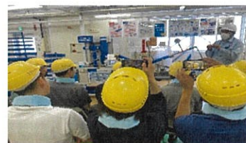
エスロハイパー-AWの性能実験