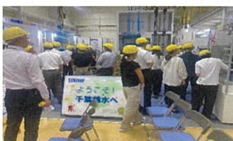
展示ホールの風景