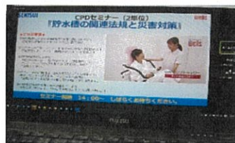
ユニットバスの講義②