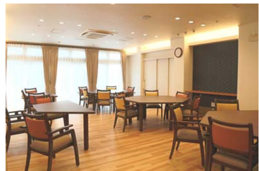
食堂と地域交流スペースがつながり、入居者と地域との交流をはぐくむ。 (食堂奥の白い扉の先が地域交流室)

また、高齢者に限らず地域住民のサークル活動や子ども向けの教室などにも「地域交流スペース」を開放し、多世代交流の拠点とする計画です。『ハイムガーデン南流山』は、地域に開かれたサ高住を目指します。