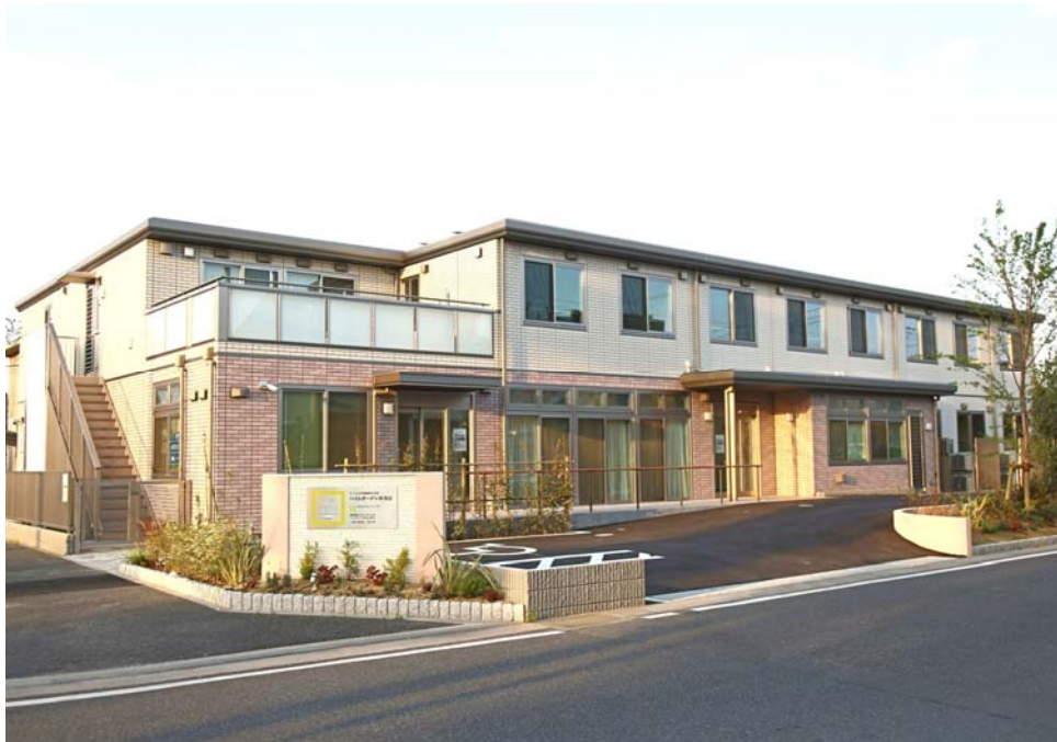
『ハイムガーデン南流山』外観