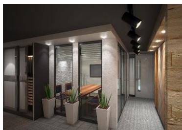
■バーチャルルーム(イメージ)

「バーチャルルーム」では、ご希望のキッチンやバス、サニタリーの収納・面材を選び大画面で確認することで、空間の雰囲気をチェックすることができます。