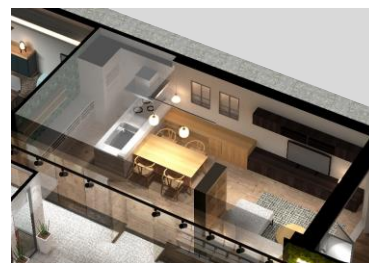
■シミュレーションルーム(イメージ)

照明器具や照度、色温度の違いにより空間イメージの変化を再現できる照明のシーン別シミュレーションや臨場感溢れる音響システムのほか、最先端の快適な生活提案として、当社のIoT住宅パッケージ『カジサポ』のデモンストレーションを行います。スマートスピーカーでの各種家電のコントロールによる家事負担軽減など、忙しい共働き家族の団欒と安心を深める先進技術の体験ができます。