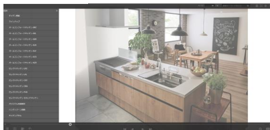
■バーチャルルームでの映像

建てる前に、できる限りわかりやすく、新居のイメージを膨らませていただくためのバーチャルコーナーを用意しました。