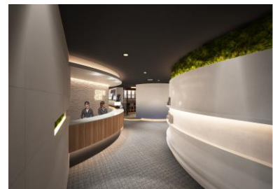
■ エントランス(イメージ)

施設利用は原則として、当社住宅をご検討中のお客様、ご契約いただいたお客様を対象とした完全予約制となります。