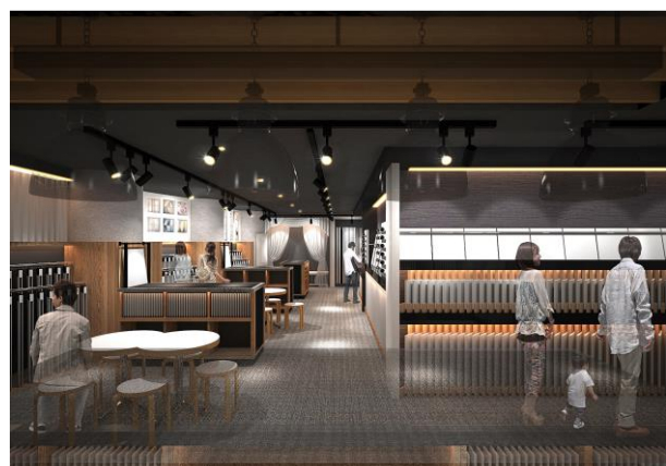
■ サンプルバンク(イメージ)

天井や壁クロス、床材などの各種内装材や建具、カーテンのバリエーションを、「サンプルバンク」に集められた豊富な大判サンプルを用いて、様々なコーディネートパターンで比較することができます。インテリアコーディネーターのアドバイスをもとに、材質による質感や色合いの違い、組み合わせによって変わる空間の雰囲気をしっかり確かめながら決めていくことができます。