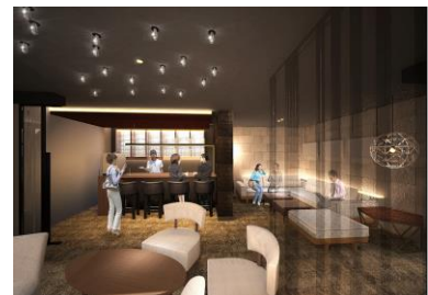
■ ラウンジ(イメージ)