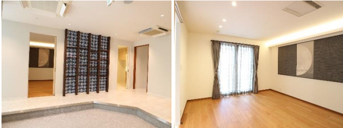
和室を主寝室に改装した 間取りが再現されたスペース

大空間のプラン変更が容易なセキスイハイムのユニット工法を活用した、ご家族構成が変化した後のご夫婦二人暮らしのご提案や、1 階和室を主寝室に大幅に改装した実例や、水廻りの家事動線がスムーズに生まれ変わる事例をご紹介します。