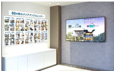
蓄電池のある暮らしを 映像などで解説

セキスイハイムグループでは太陽光発電システム搭載住宅がリフォームも含め累積建築棟数が210,262棟 *1 にのぼるなど、CO 2 削減に貢献する環境貢献商品の開発・普及に努めています。『セキスイファミエスミュージアム茨城』では、これまでに得たノウハウをリフォームに展開する「再生可能エネルギーの有効利用（太陽光発電システム・蓄電池）」、「高耐久外装材（タイル外壁・ステンレス外装材）」・「省エネ性強化（高断熱サッシ）」などについてご紹介しています。