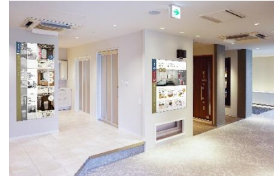
将来を見据えた最適な サニタリースペース