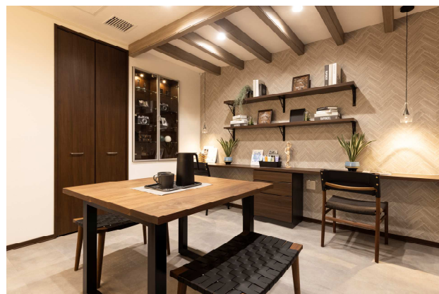
快適な在宅就業を実現する テレワークコーナー