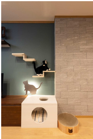
ペットとの程良い距離感 心地よい生活

「新しい生活様式 ※1 」提案：テレワーク専用デスクで快適な在宅就業、買い物回数を減らして感染リスクを低減させるパントリー、災害時に避難所の「密」を避ける在宅避難の選択（蓄電池体験）などをご紹介します。