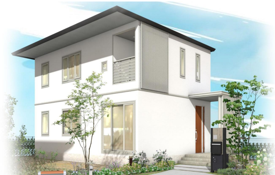
A 棟完成予想図(外観)

(外観イラストは、計画段階の図面を基に描き起こしたもので 形状・仕様・植栽・色彩等は実際とは多少異なります。)