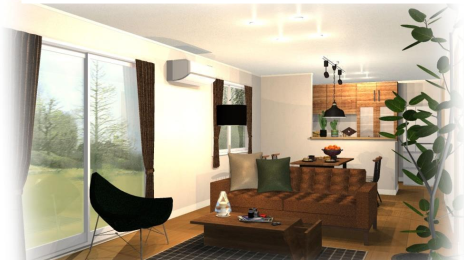
A 棟完成予想図(内観)

(外観イラストは、計画段階の図面を基に描き起こしたもので 形状・仕様・植栽・色彩等は実際とは多少異なります。)