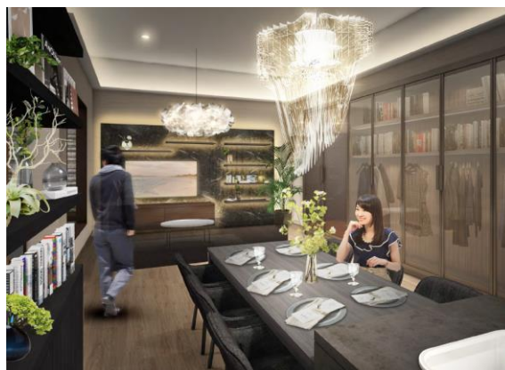
■ 実物サイズのLDK（イメージ）