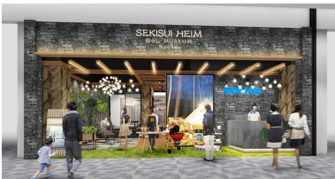
■ エントランス：うちにいながらアウトドアを楽しむウチソト空間の演出（イメージ）

LDKスペースでは、AIスピーカーを使用したIoT住宅のデモンストレーションを行います。音声で照明や空調を調整いただくことで、その利便性をご確認いただけます。