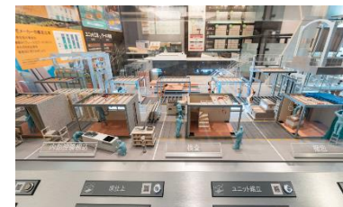
▲可動型工場ジオラマ

セキスイハイムの工場生産の全貌を再現したジオラマと共に、家づくりの各工程を解説します。タブレット端末のカメラ機能を用いたQRコード※5を読み込むことで、ジオラマと連動した実際の工場内建築シーンの映像をご覧いただけます。