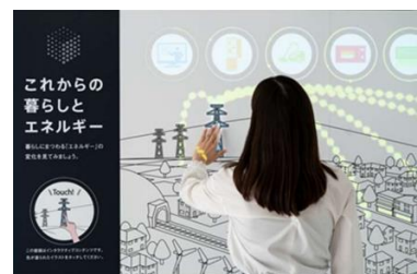
▲インタラクティブ・コンテンツ 「これからの暮らしとエネルギー」

社会・暮らし・住まいとエネルギーの関係を、タッチセンサー技術を活用したプロジェクションマッピングによる図解コンテンツで解説します。