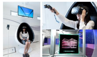
▲ハイムユニットVR(イメージ)

ヘッドマウント型の360°VR体感装置を導入し、建物の仕組みや構造、建築工程を体験できます。映像は、仮想空間バーチャルファクトリー内で、家づくり博士の「ドクターハイム」が登場するコンテンツです。アトラクション感覚で家づくりをご体感いただけます。