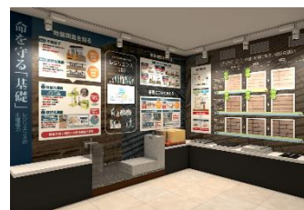
▲ハイムスタディギャラリー(2階)

「ハイムスタディギャラリー（2階）」においては、人生100年時代に備えるレジリエンス機能に優れた住まいの条件をお伝えすることを目的に、災害発生時における建物倒壊の仕組みを通して、鉄骨（ブレース・ラーメン）構造住宅の特徴や、災害発生直後の不同沈下や液状化リスクを抑える地盤改良と基礎づくりについて、実物の鉄骨スkeleton展示や基礎模型展示、アニメーション映像を使って、わかりやすく解説します。