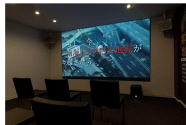
▲巨大地震体感4Dシアター(イメージ)

南海トラフ巨大地震のシミュレーション動画などで構成された映像と大音響に加え、今回新しく採用した4D技術※4（「振動」「フラッシュ演出」「風の体感」）により臨場感をもって体感していただくことで、減災住宅の重要性・必要性を解説します。