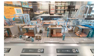
▲可動型工場ジオラマ

セキスイハイムの工場生産の全貌を再現したジオラマと共に、家づくりの各工程を解説します。タブレット端末のカメラ機能を用いてQRコード*1を読み込むことで、ジオラマと連動した実際の工場内建築シーンの映像をご覧いただけます。