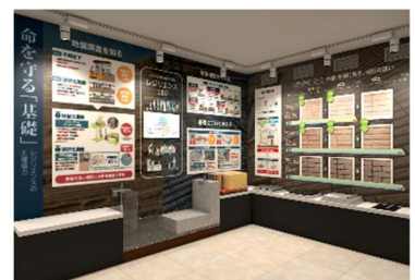
▲ハイムスタディギャラリー（2階） ※イメージ

「ハイムスタディギャラリー（2階）」においては、東北地方の自然災害に強い家づくりの条件をお伝えすることを目的に、災害発生時における建物倒壊の仕組みを通して、鉄骨（ブレース・ラーメン）構造住宅の特徴や、災害発生直後の不同沈下や液状化リスクを抑える地盤改良と基礎づくりについて、実物の鉄骨スケルトン展示や基礎模型展示、アニメーション映像を使って、わかりやすく解説します。