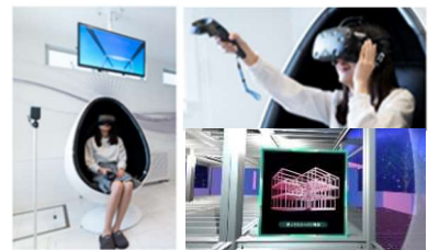
▲ハイムユニットVR ※イメージ

ヘッドマウント型の360°VR体感装置を導入し、建物の仕組みや構造、建築工程を体験できます。映像は、仮想空間バーチャルファクトリー内で、家づくり博士の「ドクターハイム」が登場するコンテンツです。アトラクション感覚で家づくりをご体感いただけます。