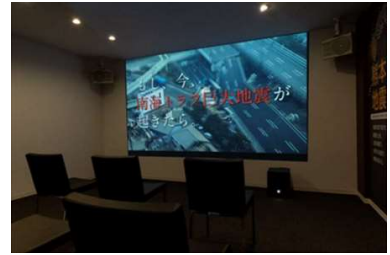
▲自然災害発生シミュレーションシアター ※イメージ

東北地方の自然災害発生シミュレーション動画などで構成された映像と大音響に加え、「フラッシュ演出」「風の体感」により臨場感をもって体感していただくことで、減災住宅の重要性・必要性を解説します。