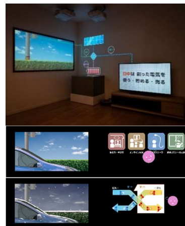
▲(上)未来型スマートハイム体感 ▲(中)新生活様式の解説 ▲(下)冬の換気方法について ※画像はイメージです

セキスイハイムのスマートハウス「スマートハイム」で実現可能な HEMS ※2 機能、IoT による暮らしの利便性、将来の拡張性について、一日の暮らしを再現するプレゼンテーションでお伝えします。また、感染リスクへ配慮した暮らしへの対応力を高めた、換気・空調システムの実演など、日常生活の安全を守る、最新の住設備についても体感していただきます。