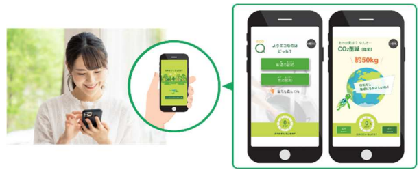
■ 「グリーンクエスト」でエコクイズに挑戦

地球環境の大切さや可能な限り自宅で発電した電気を使うグリーンな暮らしについて、プロジェクションマッピングなどにより見える化し、分かりやすくナビゲートします。