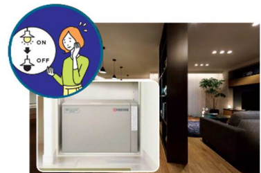
■ 大容量蓄電池(12kWh)による停電の暮らし体験(イメージ)

『GREENMODEL PARK 川越』では、平常時では実感が難しい停電時の生活を体験いただくため、実際の停電状況を再現し、在宅避難を疑似体験していただくことが可能です。大容量のPVや蓄電池を搭載した住宅は、停電時にどれだけの電気を使用できるのか実際に体験いただけます。