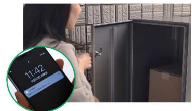
■ HEMSと連携した宅配BOXの荷受け体験(イメージ)

HEMS ※3 と連携した宅配BOXにより、スマートフォンで配達状況の確認が可能 ※4 となります。宅配のデモ体験により、配達物の受取確認や再配達依頼の手間解消などの利便性が実感できます。