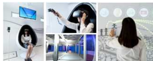
■ 家づくりの知識をバーチャル映像などで学べる「ハイムギャラリーパーク大宮」