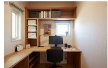
■ 在宅ワーク対応プランの体験(イメージ)

リビング等の居室に入る前に、玄関ホール内で手洗いやコート収納などを行える間取りとし、ウイルスや花粉を出来る限り居室内に持ち込まない暮らしをイメージしていただけます。在宅ワークスペースにはカウンターデスクや本棚などを設え、オンライン会議も想定した空間設計や快適さを実際に体験できます。