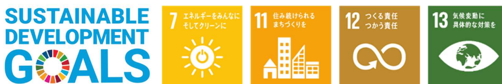
■ 『GREENMODEL PARK 稲沢』で目指す SDGs

これらの商品で提案しているニューノーマル時代にふさわしい新しい暮らし方（地球環境にやさしい暮らし、新しい生活様式に対応した暮らし、自然災害にも対応できるレジリエントな暮らし）は、住宅購入検討者にとって見える化しにくく、その生活ベネフィットを実感することが難しいという側面があります。セキスイハイム誕生 50 周年を機に、スマートハウスの一層の訴求力向上を推進しており、リアルな生活シーンを体験できる『GREENMODEL PARK 稲沢』により、新しい暮らし方をわかりやすい形で提案します。SDGs の実現も目指しながら、社会課題解決に貢献する住宅の普及を加速していきます。