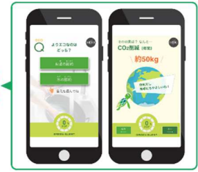
■ 「グリーンクエスト」でエコクイズに挑戦