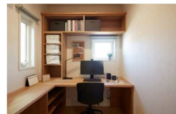
■ 在宅ワーク対応プランの体験(イメージ)

また、当社オリジナルの換気・全室空調システム「快適エアリー」による適正な換気と快適な温熱環境も体感できます。