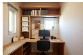
■ 在宅ワーク対応プランの体験 (イメージ)

リビング等の居室に入る前に、玄関ホール内で手洗いやコート収納などを行える間取りとし、ウイルスや花粉を出来る限り居室内に持ち込まない暮らしをイメージしていただけます。在宅ワークスペースにはカウンターデスクや本棚などを設え、オンライン会議も想定した空間設計や快適さを実際に体験できます。