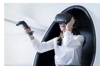
■ VR ゴーグルでの建物構造体感 (イメージ)

建ててからでは確認できない建物内部の構造躯体や基礎、接合部などを、VR ゴーグルを使ってバーチャルで体感していただけます。