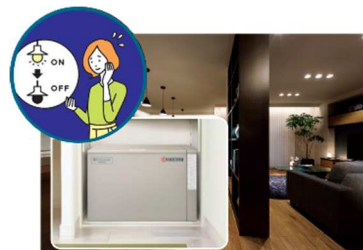
■ 大容量蓄電池 (12kWh) ※5 による停電の暮らし体験(イメージ)

『GREENMODEL PARK 長崎みなと坂』では、平常時では実感が難しい停電時の生活を体験いただくため、実際の停電状況を再現し、在宅避難を疑似体験していただくことが可能です。大容量の PV や蓄電池を搭載した住宅は、停電時にどれだけの電気を使用できるのか実際に体験いただけます。