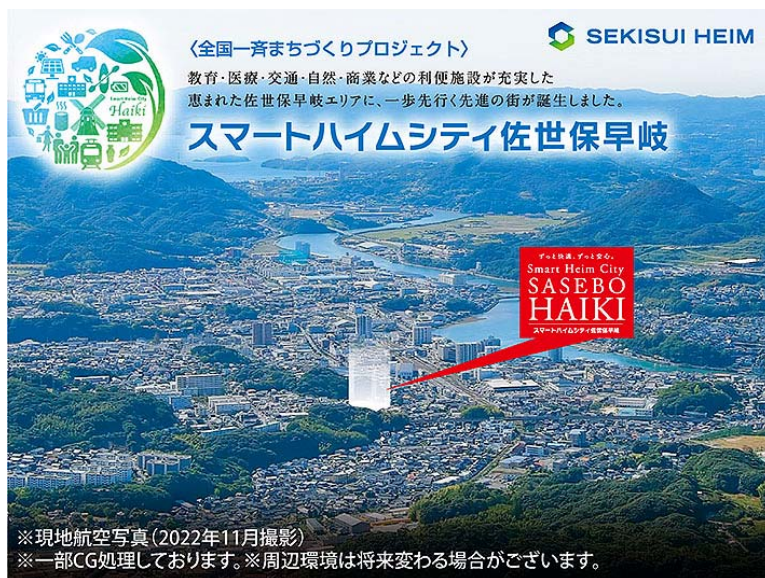
『スマートハイムシティ佐世保早岐』のロケーションイメージ

「スマート&レジリエンス」をコンセプトとし、環境・快適・安心を実現するセキスイハイムと積水化学グループの際立ち技術を導入した、ハイスペックな戸建分譲地です。また、周辺環境についても、交通アクセス、ショッピング、教育施設、レジャー施設、アクティビティなど、快適に暮らすための環境が整ったまちです。