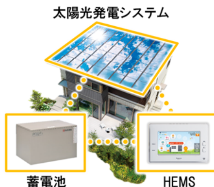
3点セット(PV、蓄電池、HEMS)を全邸で搭載

『スマートハイムシティ佐世保早岐』の建物は、高い品質管理のもと工場生産される高気密・高断熱の躯体性能と PV (4kW 以上推奨) の搭載により、請負、建売の形態を問わず、全邸を ZEH 仕様※1 とします。加えて、セキスイハイムの際立ちである蓄電池 (12kWh※7 推奨)、HEMS も全邸で採用し、可能な限り自然エネルギーを活用するグリーンな暮らしを実現します。