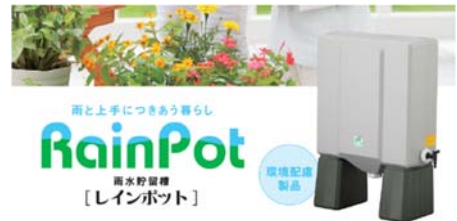
雨水貯留槽「レインポット」