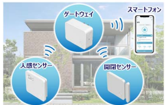
窓などからの侵入を検知するホームセキュリティ

まち全体で防犯意識を向上させることで、安心して長く暮らせるまちづくりを目指します。