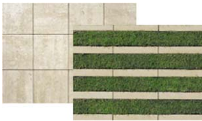
保水ブロック/植生ブロック