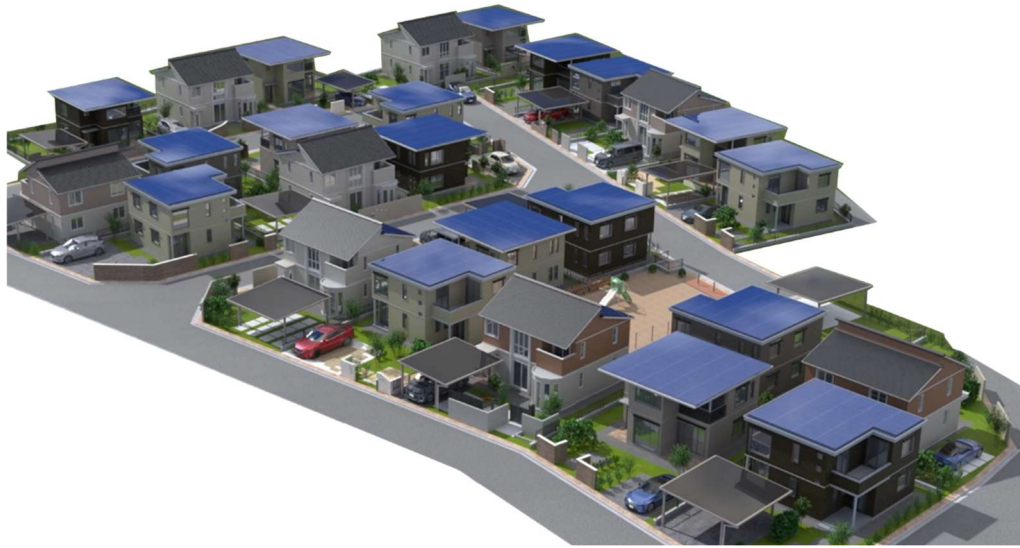
『ユナイテッドハイムパーク比叡山坂本』の街並みイメージ