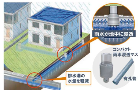
台風・豪雨による浸水被害から街を守る コンパクト雨水浸透マス+有孔管

また、停電時でも電気が使える蓄電池 ※4 を標準採用。断水時でも数日分の飲料水を確保できる「飲料水貯留システム ※5 」の設置も選択可能です。ライフラインを維持することで、災害時の在宅避難 ※6 を可能にします。