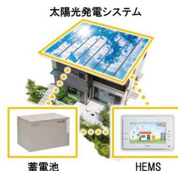
3点セット(PV、蓄電池、HEMS)を全邸搭載

快適な室内環境の確保やカーボンニュートラル社会への貢献を目指し、全邸を『ZEH』仕様※1とします。高い品質管理のもと工場生産される高気密・高断熱の躯体性能をベースに、PV（4kW以上推奨）、蓄電池（4kWh以上）、HEMS「スマートハイムナビ」の3点セットを全邸で採用。可能な限り自然エネルギーを活用し、電力価格高騰リスクにも対応するグリーンな暮らしを実現します。