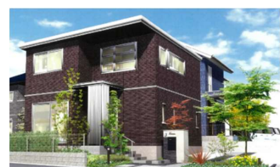
まちなみデザインガイドラインの 外構計画イメージ

加えて、美しく統一された街並みを維持するために、「60年・長期サポートシステム」により建物の定期診断 ※8 を60年間無償で実施するほか、日々の困りごとやリフォーム、住み替え、高齢期の相談まで、末永く快適に暮らせるアドバイスやサポートをセキスイハイムグループ全体で実施します。多世代にわたって価値が続くサステナブルなまちを実現します。