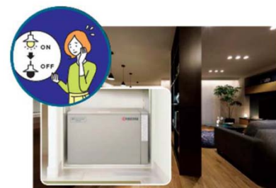
■大容量蓄電池(12kWh ※5 )による停電の暮らし体験(イメージ)

『GREENMODEL PARK 松本市里山辺』では、平常時では実感が難しい停電時の生活を体験いただくため、実際の停電状況を再現し、在宅避難を疑似体験していただくことが可能です。大容量の PV や蓄電池を搭載した住宅は、停電時にどれだけの電気を使用できるのか実際に体験いただけます。