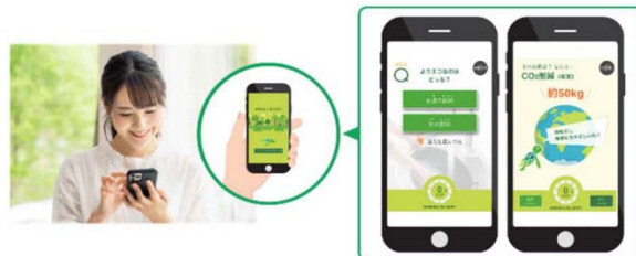
■「グリーンクエスト」でエコクイズに挑戦

地球環境の大切さや可能な限り自宅で発電した電気を使うグリーンな暮らしについて、プロジェクションマッピングなどにより見える化し、分かりやすくナビゲートします。