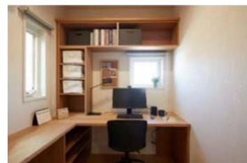
■在宅ワーク対応プランの体験(イメージ)

リビング等の居室に入る前に、玄関ホール内で手洗いやコート収納などを行える間取りとし、ウイルスや花粉を出来る限り居室内に持ち込まない暮らしをイメージしていただけます。在宅ワークスペースにはカウンターデスクや本棚などを設え、オンライン会議も想定した空間設計や快適さを実際に体験できます。