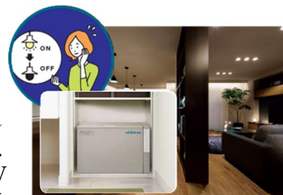
■ 大容量蓄電池(12kWh ※5 )による停電の暮らし体験(イメージ)

『GREENMODEL PARK 掛川』では、平常時では実感が難しい停電時の生活を体験いただくため、実際の停電状況を再現し、在宅避難を疑似体験していただくことが可能です。大容量の PV や蓄電池を搭載した住宅は、停電時にどれだけの電気を使用できるのか実際に体験いただけます。