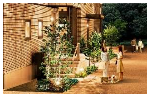
まち全体に連続した灯りを生む照明計画

住宅にはIoT防犯システム「セキュナビ」※5を全邸で採用。HEMS等と連動することで、玄関や窓の施錠状態の確認や開錠通知の受け取りがスマートフォン※8で行え、外出時でも速やかに異常を知ることができます。まち全体で防犯意識を向上させることで、安心して長く暮らせるまちを目指します。