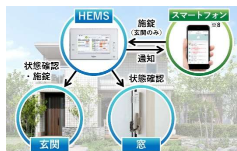
HEMS 連携型 IoT 防犯システム「セキュナビ」※5