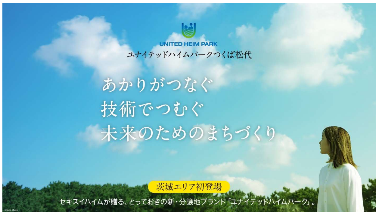
『ユナイテッドハイムパークつくば松代』物件コンセプト

『ユナイテッドハイムパークつくば松代』は、この新ブランドの茨城エリア第 1 弾となります。快適・便利で地球環境にやさしいセキスイハイムのスマート技術と、災害に強い積水化学グループのインフラ技術を活用し、発展著しいつくばエリアの立地特性を活かし、長く安心して住み継がれるサステナブルなまちづくりを目指します。