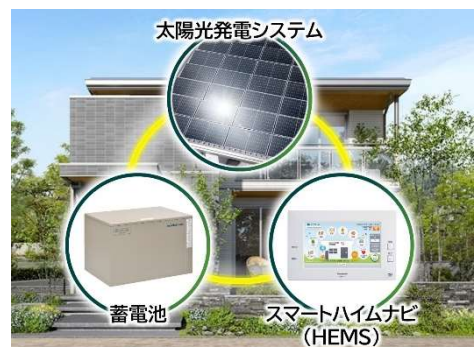
3点セット(PV、蓄電池、HEMS)を全邸で搭載

快適な室内環境の確保や、カーボンニュートラル社会への貢献を目指し、請負、建売の形態を問わず、全邸を ZEH 区分の中でも Nearly ZEH、ZEH Oriented を含まないエネルギー削減率が最高ランクの『ZEH』仕様とします。セキスイハイムの際立ちである高い品質管理のもと工場生産される高気密・高断熱の躯体性能をベースに、PV (4kW 以上推奨)、蓄電池 (4.9kWh *6 以上)、HEMS「スマートハイムナビ」を全邸で採用。可能な限り自然エネルギーを活用し、電力不安の少ない暮らしを目指します。