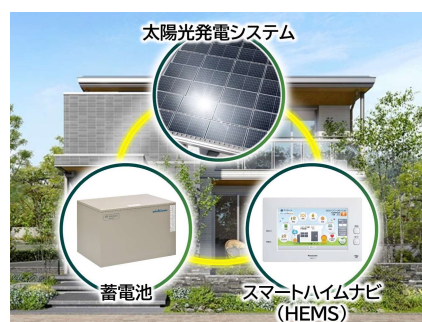
3点セット(PV、蓄電池、HEMS)を全邸搭載

快適な室内環境の確保やカーボンニュートラル社会への貢献を目指し、全邸を『ZEH』仕様※1とします。高い品質管理のもと大半が工場生産される高気密・高断熱の躯体性能をベースに、PV(4kW以上推奨)、蓄電池(4.9kWh以上※2)、HEMS「スマートハイムナビ」の3点セットを全邸で採用。可能な限り自然エネルギーを活用し、電力価格高騰リスクにも対応するクリーンな暮らしを実現します。