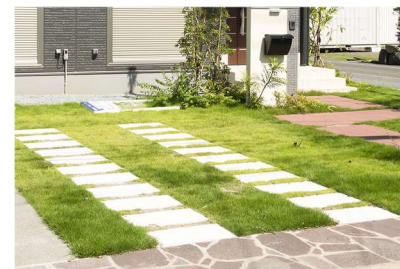
見た目にもやさしい「グリーンインフラ」 雨水対策や環境保全にも貢献 ※8

また、停電時でも電気のできる蓄電池 ※6 を標準採用することで、災害時の在宅避難 ※7 を可能にします。