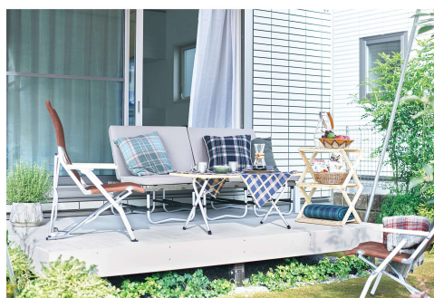
第 17 回キッズデザイン賞 子どもたちが産み育てやすいデザイン部門 「うちそと Switch テラス」受賞

安心して暮らせる住まいに、開放的な外の心地よさをプラスする「うちそと Switch テラス」を導入。自宅にいながら自然に触れ合い遊ぶ中で、お子様の豊かな感受性を育みます。また、大切な友人を招いての食事パーティーや、ひとりでゆっくりくつろぐ時間など、シーンに合わせて様々な用途で使用できる空間です。「うちそと Switch テラス」には、より気軽にそと遊びへの切り替えができるよう、テラスから室内を通らずものを運べる「外もの収納」や、簡単にタープが取り付けられる「タープリング*10」、そとでの食事を簡単にできる「屋外コンセント」など備え、準備や片付けの負担を軽減します。