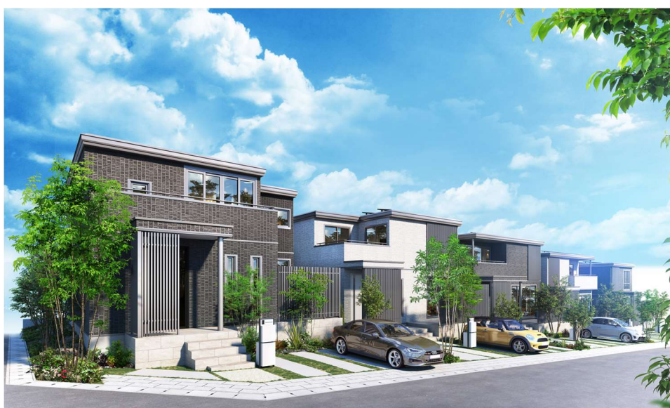
『ユナイテッドハイムパーク桑名市北別所』のまちなみイメージ*12

加えて、「60年・長期サポートシステム」により建物の定期診断*11を60年間無償で実施するほか、日々の困りごとやリフォーム、住み替え、高齢期の相談まで、末永く快適に暮らせるアドバイスやサポートをセキスイハイムグループ全体で実施し、多世代にわたって価値が続くサステナブルなまちを実現します。