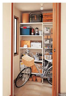
そと遊びへの切り替えがしやすい 「外もの収納」