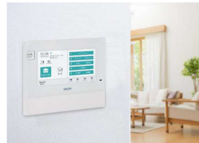
セコム「ホームセキュリティ」 ※9

自然災害時の安心だけでなく日常の安心も確保するため、セコム「ホームセキュリティ」を全邸に標準装備します。防犯センサーによる侵入の感知や、室内の煙や温度変化による火災の発生感知、緊急時には、非常ボタンを押すだけで通報でき、セコムが駆けつけます。まち全体で防犯意識を向上させることで、安心して永く暮らせるまちづくりをサポートします。