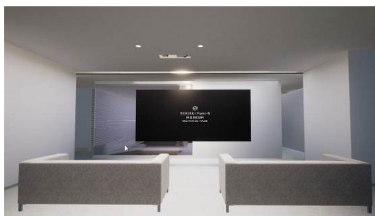
オーナーズラウンジ

セキスイハイムグループでは、住宅を引き渡した後も住まいの経年変化や暮らしの変化に対応できるよう、長期にわたって快適に暮らせるアドバイスやサポートをしています。本ショールームでは、リフォームの提案以外にも、住まいの定期診断 ※1 の結果報告や各種セミナー・イベントの場としても活用します。また、巨大スクリーンに映し出される映像を楽しみながら寛げる「オーナーズラウンジ」を設置するなど、オーナー様とのコミュニケーションを強化してまいります。