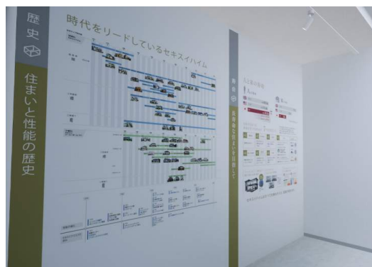
セキスイハイムの歴史と商品紹介パネル