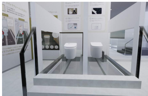
床構造に対応した配管が確認できるトイレ展示

トレンドのキッチン・トイレ・洗面化粧台・浴室などの水まわり設備を展示しています。また、家族構成の変化などに伴うプラン変更や快適に過ごすための先進設備など、新しい暮らしを楽しむための提案をしています。壁クロス、床材、カーテンなどの内装サンプルも展示し、お客様がイメージしやすいリフォームを計画していきます。