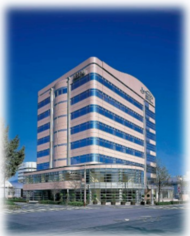
群馬セキスイハイム本社ビル外観