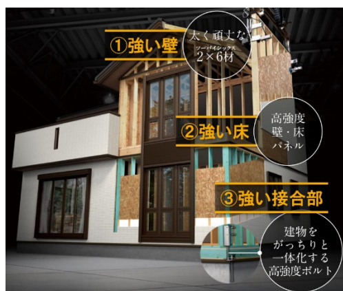
優れた耐震性をもつ独自のアルティメイトモノコック構造

また、太陽光発電システムと蓄電池、独自のエネルギー管理システム（HEMS）「スマートハイムナビ」も搭載可能。昼も夜もできるだけ再生可能エネルギーを活用し、地球環境と光熱費抑制に貢献するとともに、自然災害などによる停電時も普段に近い生活を送ることができる安心の住まいです※3。