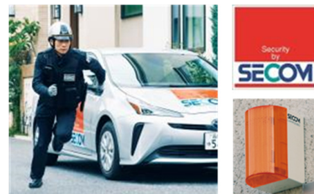
「セコム・ホームセキュリティ※2」

また、スマートフォン※10を使用して遠隔で警備のセット解除が可能です。まち全体でホームセキュリティを導入することで、防犯意識が高まり、安心して永く暮らせる環境を実現します。