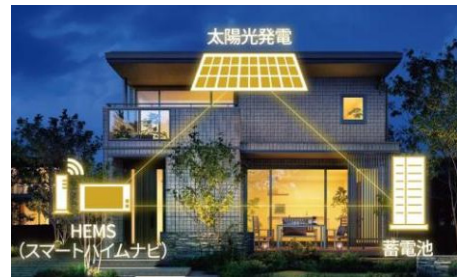
3点セット(PV、蓄電池、HEMS)を全邸搭載

快適な室内環境の確保やカーボンニュートラル社会への貢献を目指し、全邸を『ZEH』仕様※1とします。高い品質管理のもと大半が工場生産される高気密・高断熱の躯体性能をベースに、PV、蓄電池(4.9kWh以上※7)、HEMS「スマートハイムナビ」の3点セットを全邸で採用。可能な限り自然エネルギーを活用し、電力価格高騰リスクにも対応するクリーンな暮らしを実現します。