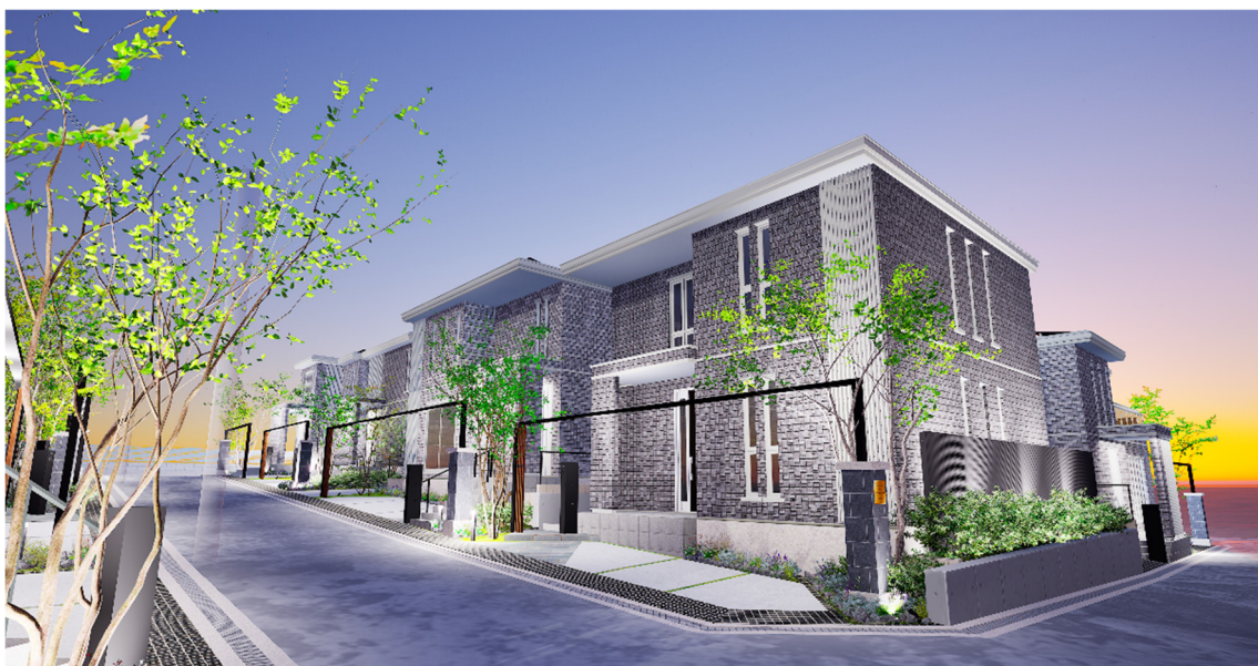
『ユナイテッドハイムパーク豊中上野東』のまちなみイメージ※6

所在地：大阪府豊中市市上野東2丁目140番31、他9筆 交通：大阪モノレール「少路」駅 徒歩15分（1,130～1,160m） 開発面積：2,832.40㎡ 地目：宅地 用途地域：第一種低層住居専用地域 建ぺい率・容積率：60%・150% 事業主・売り主：セキスイハイム近畿株式会社 設備等の概要：上水道：公共水道、下水道：公共下水、雨水：側溝等、電気：関西電力 道路：幅員4.7m（アスファルト舗装） 造成完了年月日：2024年7月24日 総区画数：10区画 販売区画面積：119.91㎡～184.29㎡ 販売価格：未定