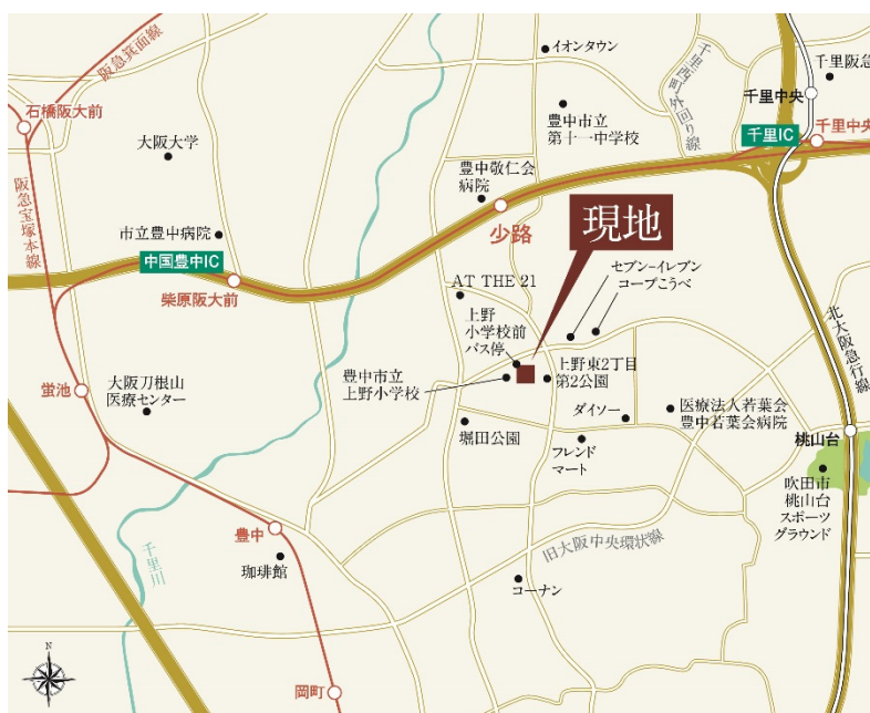
『ユナイテッドハイムパーク豊中上野東』の周辺地図