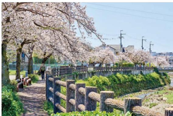
千里川沿いの桜並木(2024年4月撮影)

また、豊中市は「子育てしやすさ No.1 へ」を目標に掲げ、こども施策の充実・強化を行っています。5年間で約100億円規模の集中投資を検討（令和5年9月時点の公表）※4し、今後も子育てしやすい環境が新たに創出される可能性が高いエリアです。加えて、公立の進学校がアクセス圏内に存在。幼少期から高校教育まで一貫して充実した環境が整うことで、子育てにも良い影響をもたらしてくれます。