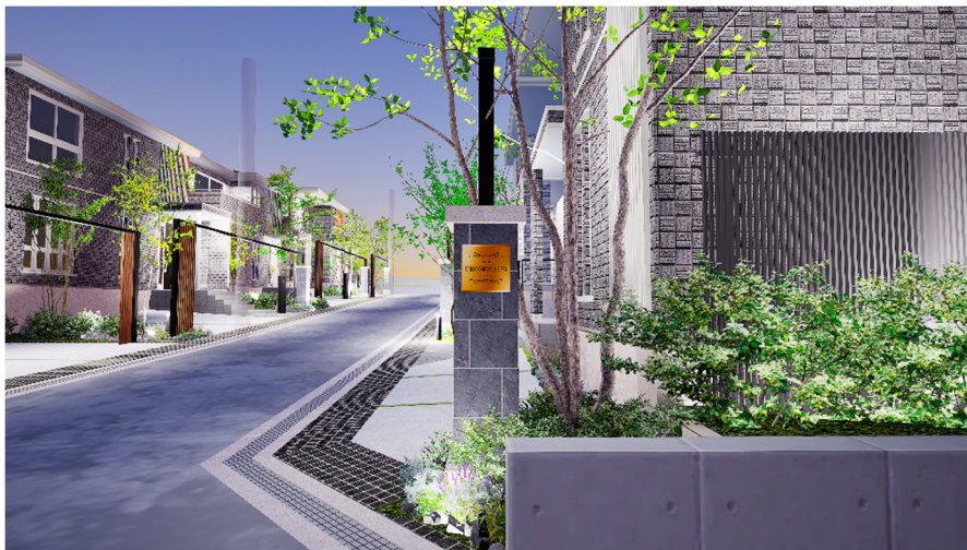
誘う（いざなう）空間例※6

加えて、統一されたまちなみを維持し住まいの資産価値を保つため、「60年・長期サポートシステム」により、建物の引渡しから2年目までの計3回の定期点検と5年目からの5年ごとの定期診断を60年間無償で実施※5します。この地域に相応しい価値を維持し続けるサステナブルなまちを実現します。