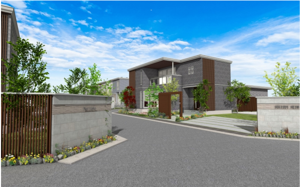
格子調のデザインをあしらったまちなみイメージ ※11

このようなエリアの魅力とつながり、まちの歴史や文化とも呼応するまちづくりを目指すため、建物・設備・駐車場・門・植栽などに関して具体的な仕様を定めた「まちなみデザインガイドライン」を策定し、美しく統一された心地よいまちなみの維持を図ります。例えば、本分譲地から長良川を挟んで東側に位置し昔ながらの日本家屋が軒を連ねる「川原町」のイメージを活かし、通風や採光に優れ、室内への視線を遮る日本古来の建具「格子戸」を模した格子調のデザインを採用しています。