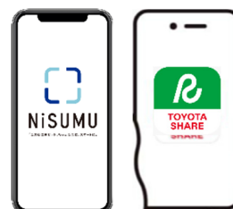
NiSUMU と TOYOTA SHARE を連携

また、シェア車両にはハイブリッド車を採用し、静かで上質な乗り心地を提供するとともに、走行時に発生するCO 2 排出量を削減することで、地球環境にも配慮します。