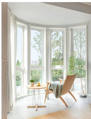
美しい弧を描くボウウインドウ