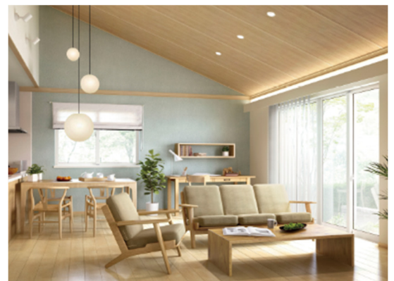
勾配天井を活かした高さのあるゆとり空間