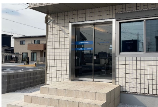
ハイムリフォームギャラリー太田 エントランス

加えて、2024年5月にオープンしたオーナー向けショールーム「セキスイファミエスミュージアム群馬」(前橋市)と並び、東毛エリアでは唯一の不動産・リフォームの情報発信拠点として、周辺のセキスイハイムオーナーに対しても、住まいの価値を維持・向上させていく様々な提案を行っていきます。住まいの定期診断 *1 の結果報告、各種セミナー・イベントの場としても活用し、コミュニケーションの強化を図ります。