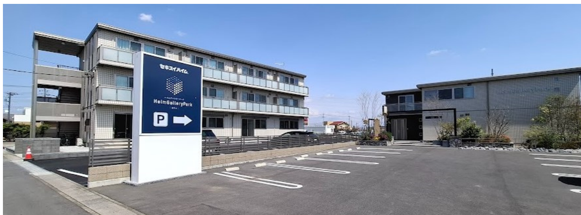
ハイムリフォームギャラリー太田 とハイムギャラリーパーク太田 外観

なお、当ギャラリーのオープンに伴い、太田駅前の「Life up square Ota（ライフ アップ スクエア太田）」（群馬県太田市飯田町 1547 OTA スクエアビル 1階）は 2025 年 4 月 6 日をもって閉館いたしました。