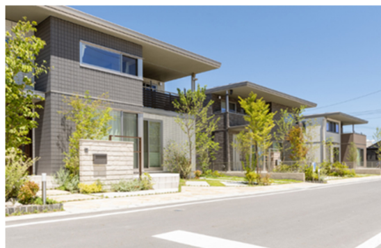
スマートハイムシティ太田 まちなみ