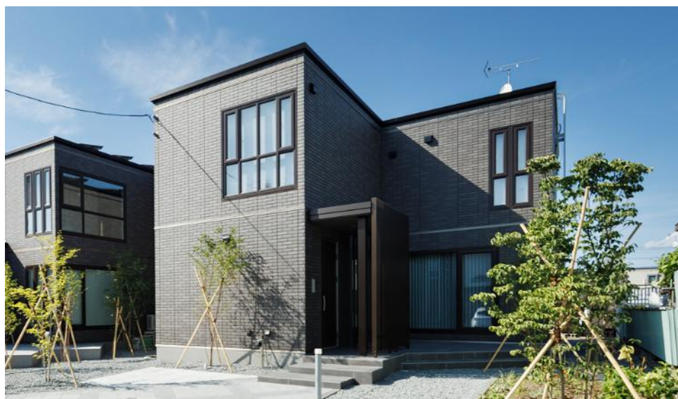
『買取り保証 ※1 』付き「ザ・デザイナーズハイム」分譲住宅の例（旭川市東光1条5丁目N0.2）

北海道セキスイハイム株式会社（本社：札幌市、代表取締役社長：村松 正臣）は分譲住宅ブランド「ザ・デザイナーズハイム」の『買取り保証 ※1 』を開始します。