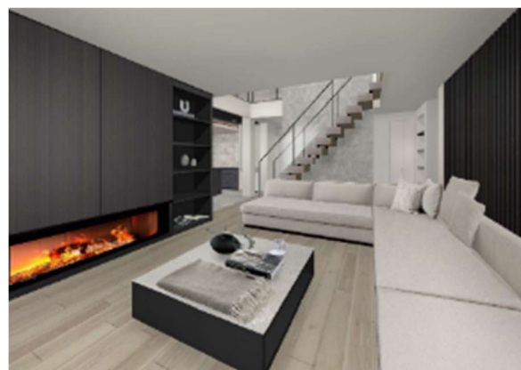
内観イメージ (Grace) ※1