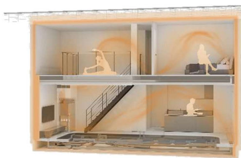
AirLax 空気の流れイメージ

従来の空調システム「快適エアリー」同様に、床下空間を暖めることで足元からあたたかい「床あったか」機能を特長としつつ、居室部分はもちろん、廊下や洗面室等の非居室部分も新たに空調可能となり、家全体 ※5 の温度差を抑制します。また、VAV (可変風量) 制御機能により、吹出口ごとに温度・風量の調節が可能です。寝室においては、入居者が設定した時間に即して、睡眠中の一般的な深部体温の動きに合わせて室温を緩やかに調整 ※6 することにより、心地よい睡眠環境をサポートします。