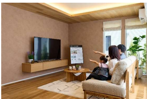
広さに頼らずに快適な「空間レイアウト」をつくるために抑えておきたいポイントを体感、共感

「レイアウト」「窓」「サイズ」「収納」などのプランニングの考え方の基本を学び、体感することができます。平面図だけでは理解が難しいプランニングをリアルサイズのモデルハウスで共感いただくことを目指します。部屋の畳数や収納の大きさだけではなく、実生活に即した「使い勝手」や「広さの感じ方」を体感することができます。