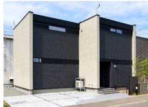
断熱等性能等級6 *1 を標準とする「Chezdan」