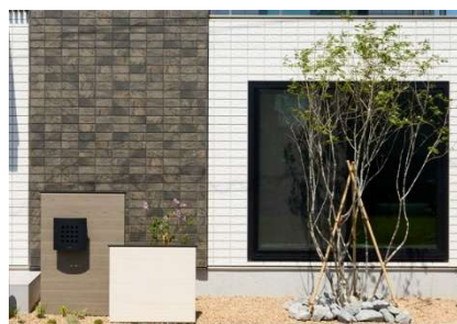
外構計画を学ぶ「ELVIA」棟

外観デザインを決定づける重要な要素の一つに「植栽」があります。建物そのもののデザインだけでなく、樹木や草花の選び方や配置によって、住まい全体の印象や街並みとの調和は大きく変わります。ELVIA棟の外構計画を確認しながら、建物をより美しく引き立てるための樹種選定や配置計画について学ぶことができます。