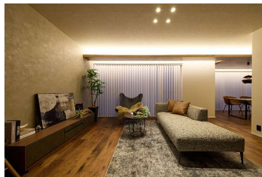
インテリアを学ぶ「Chezdan」棟

家づくりに関しては、間取りやインテリアの打ち合わせにて理想のイメージを言語化して担当者に伝えることや、カラーや素材のバランスを自ら判断することは難しく、自分の理想とするイメージと乖離してしまうケースも少なくありません。本施設のモデル棟内では、一般的なインテリア決定の進め方と、セキスイハイム独自のインテリアコーディネートシステム「SISS (Sekisui Interior Style System)」との違いについて分かりやすく解説します。SISSでは、トレンドを取り入れた7つの基本インテリアスタイルと、