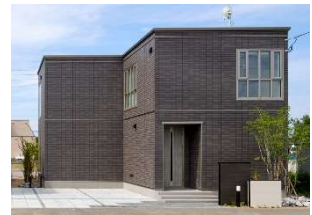
当社のロングセラーなモダンデザイン「Parfait」