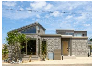
傾斜天井が心地よい平屋モデル「Parfait bj-style」