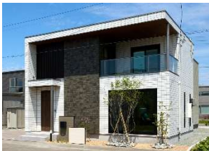
モデルハウスとしては初公開となるフラッグシップ「ELVIA」

また「ELVIA」モデルハウスには、全館空調システム *2 「AirLax（エアラクス）」を採用。「エアラクス」は、室内機1台で家全体 *1 の空調をコントロールし、住む人に合わせた心地よい温熱環境を実現する独自の「第一種換気＋全館空調システム *2 」です。他の3つのモデル棟で採用されている、床下からの輻射暖房「ウォームファクトリーH」とは異なる温熱環境を体感いただけます。