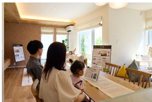
「窓」の役割と機能を確認。プランニングで見落としがちなポイントを体感、共感